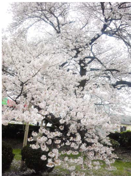
事務所近くの船橋湊町の桜です。